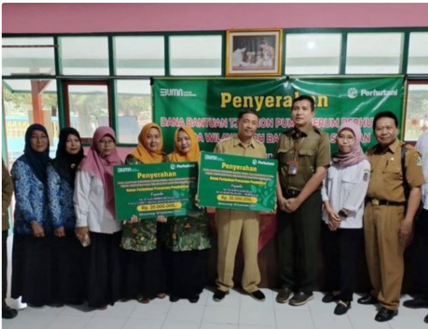
Perhutani KPH Banyuwangi Selatan menyerahkan dana bantuan TJSL sebesar Rp. 40 juta kepada dua lembaga pendidikan, Selasa (1/10/2024).

BANYUWANGI – Pendidikan merupakan pondasi utama dalam upaya mewujudkan generasi emas yang cerdas dan berkarakter. Kesadaran akan pentingnya pendidikan sebagai investasi jangka panjang untuk kemajuan suatu bangsa, menjadi dorongan utama bagi Perhutani KPH Banyuwangi Selatan untuk